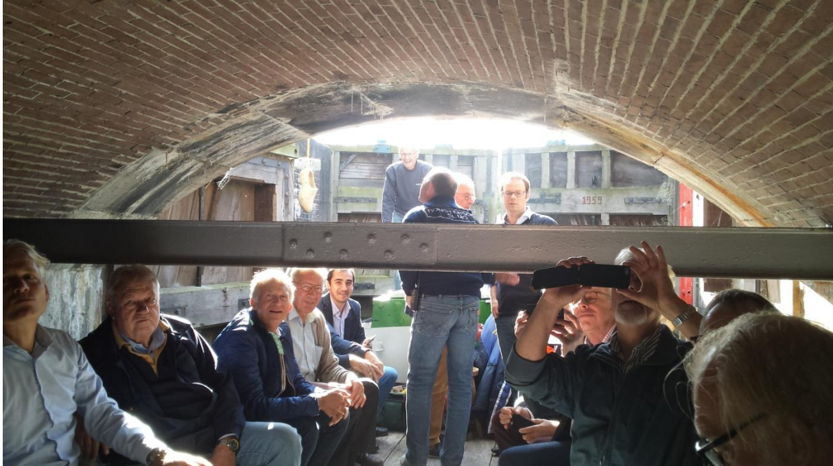
Foto Raadsleden in de Sluis

In de maand september volgen er werkbezoeken aan de sluis door de Burgemeester en Gemeenteraadsleden van gemeente Maassluis